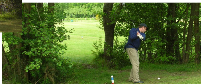
Départ du trou N°9 de Parigné l'Evêque → Un par 4 de 145 m